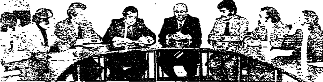
اجتماع في وزارة العمل بين الوزير تميم نعيم ، ووزير التربية ماجد صباه ، ووفد المعلمين المضرين

تتميز يوم امس ، بنشاط واسع على صعيد ايجاد حل لاضراب المعلمين ، فتمتدحت سلسلة اجتماعات في وزارة العمل ضمن تظاهرة المعلمين العامية والخاصة ووزير العمل وكبار المسؤولين ووزير التربية ، وكان من نتيجة هذه الاجتماعات ان ظهرت بوادر انسراج الدعوة مفتوحة لجميع المتضررين .